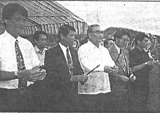
各界人士在國立藝術學院新建工程動土前焚香祈禱工程順利(左)。 國立藝術學院模型圖可窺知完工後的壯觀景象(下)。

縣環保局為加強汙染源的取締，正全面性的稽查各鄉鎮的養豬場，尤其是河川沿岸的養豬場。稽查人員前天前往將軍鄉岑仔寮稽查兩家大型養豬場時，意外接獲鄉民檢舉，指離兩養豬場一公里外有一暗管每天排放豬糞水到農田排水溝渠內。稽查人員前往查看，果然有一暗管，而且出水處的溝渠有厚厚的黑泥淤積，並發出臭味。經稽查人員詢問兩家養豬場，負責人都說暗管不是